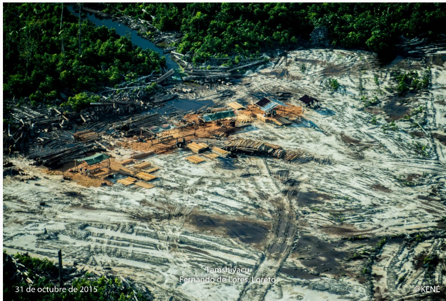
Aserraderos clandestinos de madera ilegal en áreas deforestadas, Tamshiyacu – Loreto, 2015

formaciones boscosas (Art. 310°), tráfico ilegal de productos forestales y maderables (art. 310-A) y obstrucción de procedimientos en su tipo agravado (Arts. 310°-B y 310°-C) 1 .