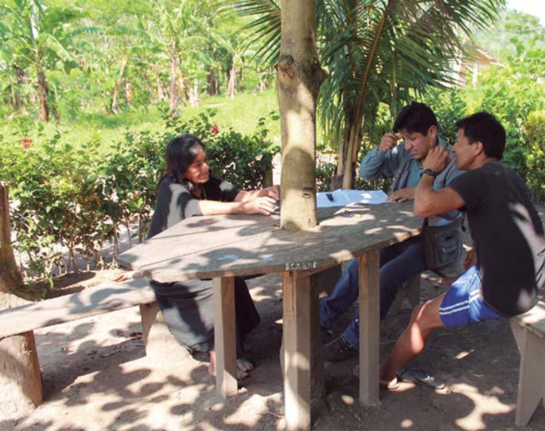
Pobladora encuestada, encuestador y guía local.

De las tres dimensiones analizadas, la socioecológica resultó ser la más limitante de la capacidad adaptativa en las dos comunidades estudiadas, principalmente por su alta dependencia del uso de recursos naturales.