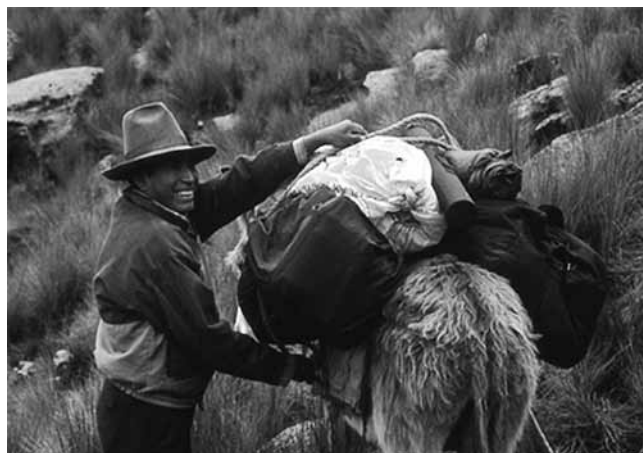
Figura 10. Arriero

arrieros para el pascoteo de sus acémilas, llamas y caballos, utilizados en el negocio turístico (Figura 10). Entre 2001 y 2007, el pueblo de Collón, utilizando sus propios recursos, construyó 40 zonas de exclusión adicionales. En 2008, se construyeron 15 más, como parte de la alianza entre TMI y el Proyecto de Conservación Alpina del Club Alpino de los Estados Unidos (Byers, 2008). A principios de los años 2000, del total de 140 cabezas que normalmente pastaban libremente en la zona alpina superior de Ishinca 100 habían pasado a Collón, presumiblemente debido a las mejores condiciones de pastoreo, dejando solamente 40 cabezas del hato original y algunas cabezas ocasionales de ganado chúcaro (Sanchez, T., comunicación personal 2009). Hacia esta época también se suspendió la práctica de quema anual de pastos en la zona andina superior de Ishinca.