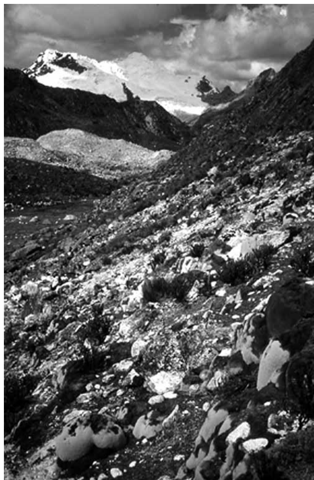
Fig. 4 Pisco refugio

ganado en la parte inferior del valle en 2001, como parte de los esfuerzos de recuperación llevados a cabo por Mato Grosso, aparentemente sin consultar a las comunidades locales o al Parque Nacional. Aunque la recuperación de la vegetación nativa en estas "zonas de exclusión" ya era impresionante en 2002, Mato Grosso aceptó retirar el cerco tras un periodo de cinco años, en algún momento durante 2006, debido a las continuas protestas de los ganaderos de la localidad. En 2009, la zona de exclusión ya se había convertido nuevamente en un terreno sobrepastoreado que sufría fuerte impacto. En la cabecera del valle, las abruptas laderas rocosas confinan una llanura abierta que sirve como campamento de base muy popular entre los montañistas y caminantes