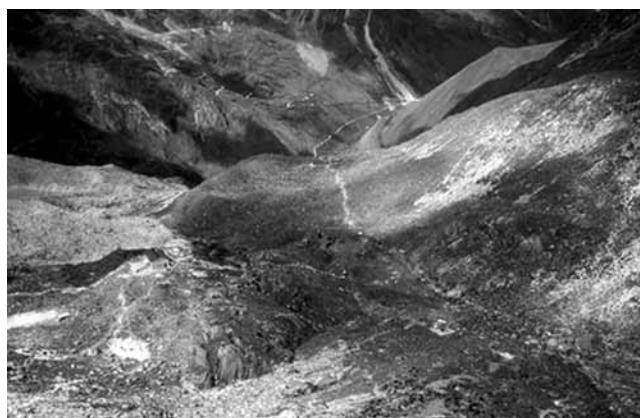
Figura 9. Pisco visto desde encima de la morrena.

pamentos de base y (c) en menor medida, el turismo de aventura no reglamentado, que se ha venido incrementando sostenidamente desde los años 60. Como se mencionó, la dinámica del suministro de energía a gran altura en el PNH es sustancialmente diferente de las condiciones que se encuentran en la región del Everest ya que en el PNH se utilizan mucho las cocinas de propano o de los campamentos para la preparación de alimentos. De igual manera, las fogatas de los campamentos son poco frecuentes y el impacto en los bosques locales de Polylepis parece ser mínimo. 3 Sin embargo, las similitudes entre las regiones del Everest y el PNH son (a) degradación de la condición de las laderas de las colinas debido al sobrepastoreo y el mayor uso de animales de carga para actividades turísticas (principalmente acémilas) (Figura 9); (b) malas prácticas y condiciones sanitarias debido a la falta de servicios higiénicos; (c) prácticas inadecuadas de eliminación de residuos en las regiones de los campamentos de base en las zonas superior e inferior; y (d) falta de conciencia de los actores—las