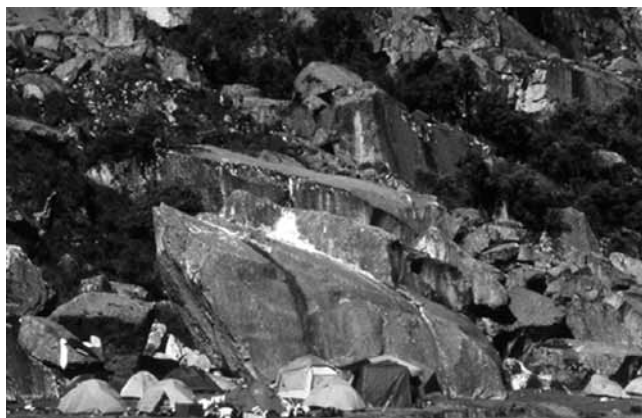
Fig. 2 Grupo de carpas en Ishinca

el número de montañistas que visitan el valle anualmente, pero probablemente sean varios miles. De la misma manera, un número indeterminado de acémilas que transporta el equipaje de los turistas se hace presente durante los meses de junio a setiembre, el periodo de máxima actividad de los caminantes y montañistas. Cuando no las están usando, pastorean libremente en las inmediaciones de los campamentos de base hasta que vuelven a Collón. En 2002 no se contaba con instalaciones sanitarias exteriores en Ishinca, y las filtraciones del campo séptico del refugio corrían libremente hacia el arroyo principal del pueblo que es la fuente de agua dulce. Debido al elevado número de montañistas y campamentos de tiendas de campaña que se agrupan en la temporada junio-setiembre (Figura 2), las condiciones sanitarias y ambientales alcanzan un nivel de degradación inaceptable al término de la temporada. También se produce una seria acumulación de desperdicios en la zona del campamento de base, aunque según se informa, los miembros de un grupo local de usuarios —Asociación de Servicios de Alta Montaña, ASAM— y los refugios Mato Grosso, se encargan de su limpieza al final de cada temporada.