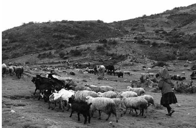
Figura 11. Collon.

Entre 4.360 m y 4.775 m de altura, los resultados muestran que había disminuido la proporción de suelo descubierto entre 70 y 100 por ciento, y que la cobertura de pastizales se había incrementado entre 39 y 69 por ciento (Figura 10) durante este periodo. La cobertura herbácea disminuyó entre 25 y 63 por ciento, presumiblemente sustituida por pasto. La cobertura porcentual de "terrazuelas" se redujo en casi 100 por ciento. No se encontró evidencia de quema y los flujos de aguas en la superficie del suelo, motivo de preocupación en 2002, ahora prácticamente habían desaparecido. La excepción a esta tendencia tan abrumadoramente favorable fue la menor estratificación a una elevación de 4.360 m -el interfaz entre las laderas de las colinas y la llanura aluvial- donde el suelo descubierto aumentó en 19 por ciento y la cobertura de pastos disminuyó en 19 por ciento. Ello se atribuyó, en 2009 al igual que en 2002, al impacto de las acémilas y caballos que se utilizan para transportar el equipo turístico a los campamentos de base y el refugio.