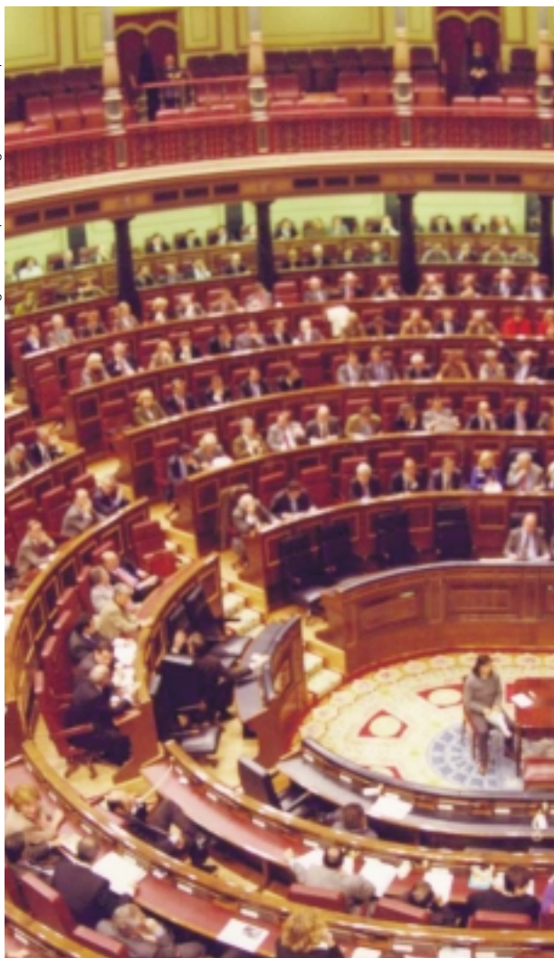
Congreso de los Diputados.