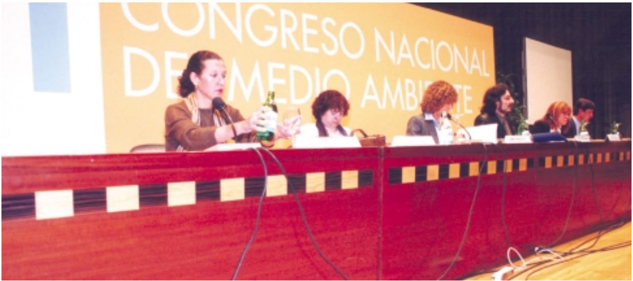
Sesión Plenaria "Políticas para un desarrollo sostenible". VI CONAMA

Hemos comprobado que, progresivamente, en los distintos programas electorales de los partidos políticos, el ámbito ambiental ha ido tomando una cierta consistencia, que dista mucho todavía de lo que consideramos adecuado. Esta tendencia se ha visto reforzada en los ámbitos autonómico y local.