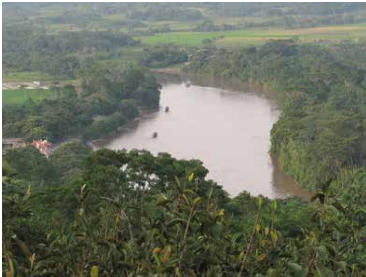
Río Mayo en Región de San Martín

Por otra parte, el PNCB trabaja con 48 comunidades nativas, las que reciben transferencias directas condicionadas equivalentes a US$ 3,80 anuales por hectárea de bosque conservado en forma voluntaria, durante un período de cinco años. En términos generales, este programa puede ser considerado un esquema estatal de retribución por servicios ecosistémicos que genera lecciones para el diseño de mecanismos de distribución de beneficios REDD+.