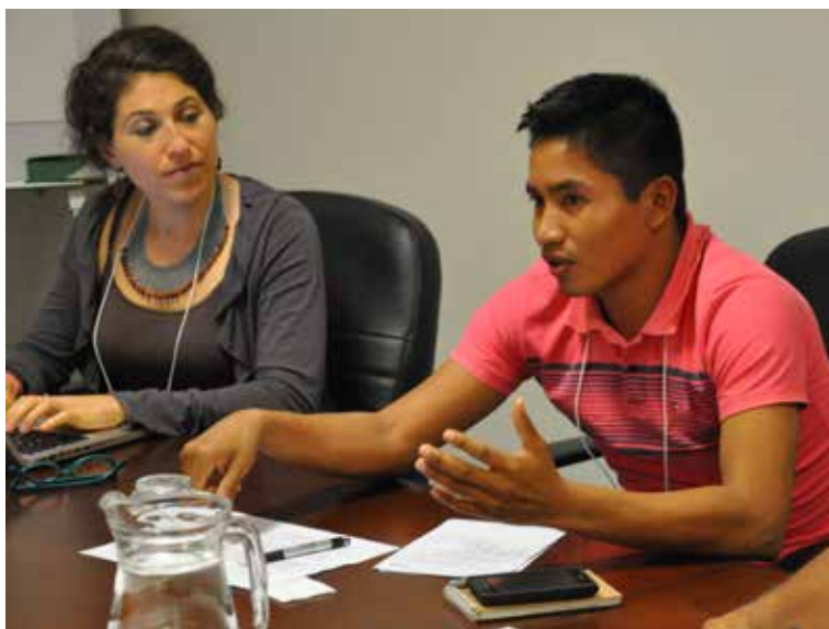
Participantes del diálogo multi-actores