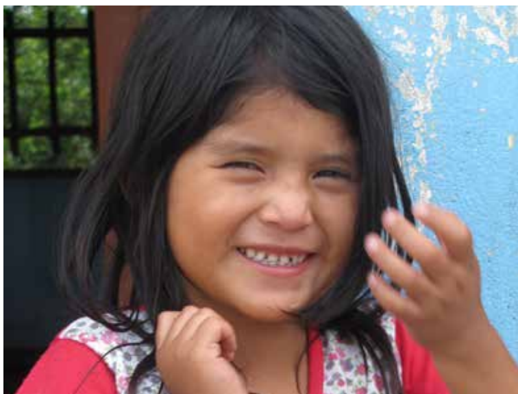
Niña de Shampuyacu

Otro beneficio de los acuerdos de conservación es la seguridad de tierras para las familias que habitan en el ANP, ya que si bien el Estado sigue siendo el propietario de la tierra, los acuerdos de conservación dan a los colonos el permiso para continuar con sus actividades dentro del ANP, a cambio del compromiso de detener la deforestación y la degradación del bosque, reduciendo así potenciales riesgos y conflictos sociales asociados al desalojo.