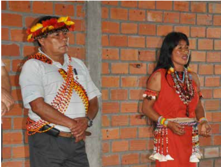
Líderes de la Comunidad Shampuyacu