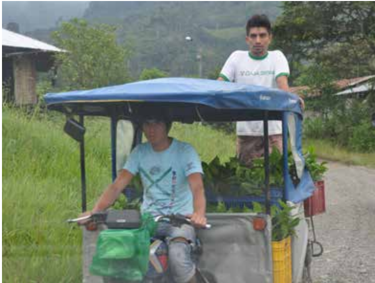
Transporte de las comunidades en el campo

Las negociaciones sobre REDD+ y los procesos nacionales de preparación para REDD+ han señalado a la pobreza como una causa de la deforestación y degradación forestal. En ese contexto se ha enfatizado sobre la necesidad de crear mecanismos de distribución de beneficios para las poblaciones más pobres, y de esa forma ser más eficientes en la inversión para la gestión de los bosques y en el abordaje de esta causa de la deforestación.