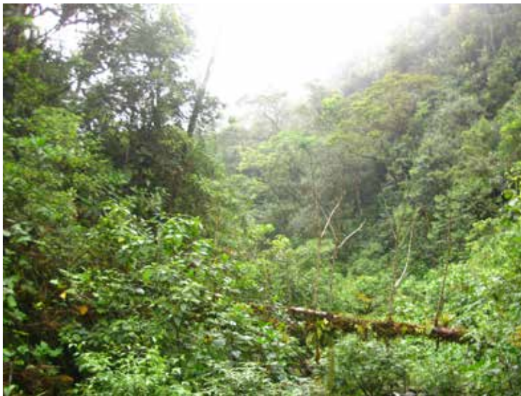
Bosques de Protección Alto Mayo