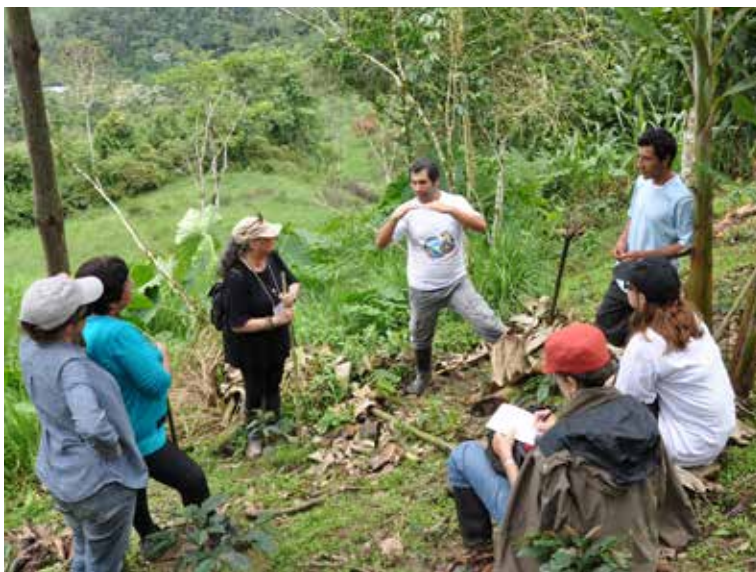
Visita a la Comunidad de Aguas Verdes