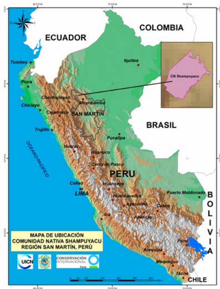
Mapa 1. Ubicación de la Comunidad Shampuyacu

La comunidad nativa Shampuyacu pertenece al Pueblo Indígena Awajun. Se ubica en la parte superior de la cuenca del Río Mayo, conocido como Alto Mayo, limitando con la zona de amortiguamiento del BPAM (Ver Mapa 1). Shampuyacu tiene 4.913 hectáreas de tierras tituladas a la comunidad, donde habitan alrededor de 600 familias. La comunidad cuenta con un Comité Directivo que es elegido por la Asamblea Comunitaria.