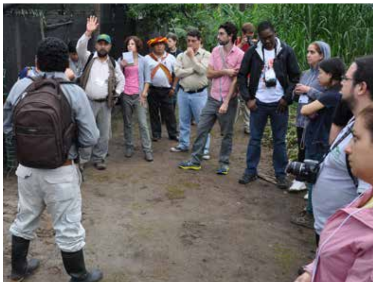
Discusión en el vivero de la Comunidad Shampuyacu

En el caso del diálogo multi-actores realizado en Perú, los participantes hicieron una visita de dos días a la Región de San Martín en la Amazonia peruana. Cada día se visitó una iniciativa diferente, el primer día se visitó la comunidad nativa Shampuyacu, donde se implementa el proyecto “Beneficios REDD+: Apoyando a países y comunidades en el diseño de esquemas para la distribución de beneficios” de UICN, el cual es implementado en alianza con CI-Perú y AIDER.